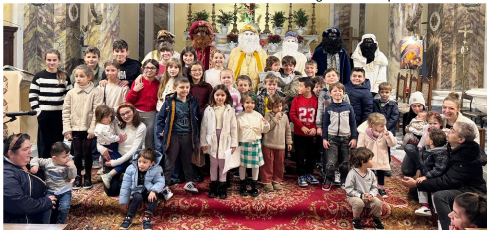
domenica 4 gennaio arrivo dei Re Magi, nella chiesa di Orentano