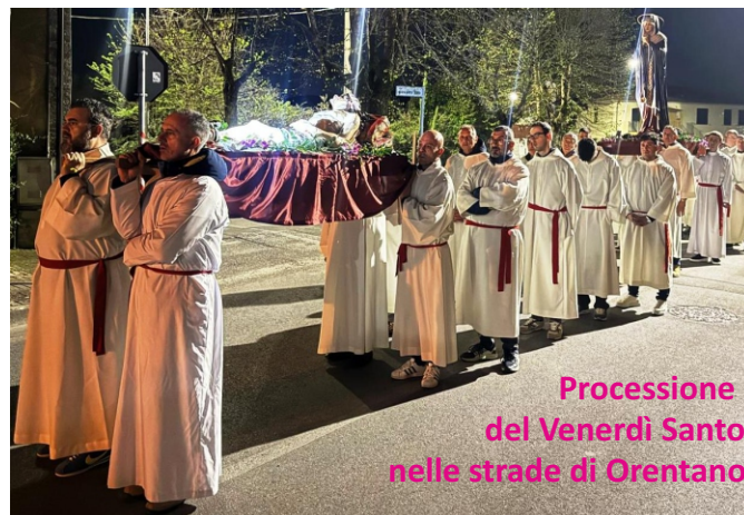
Processione del Venerdì Santo nelle strade di Orentano